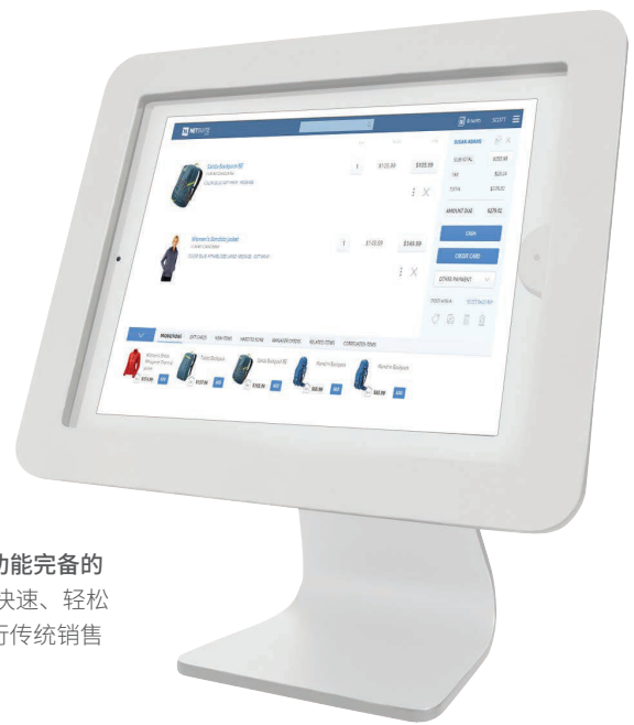
通过功能完备的 POS 快速、轻松地执行传统销售事务。