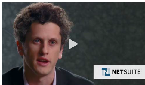
NetSuite 云 ERP 与其他先进的业务技术一起助力 Box。