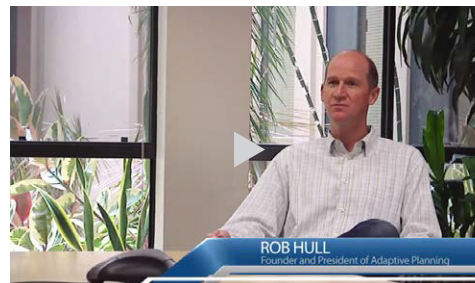
适应性洞察是超强增长型云企业发展壮大的关键因素。