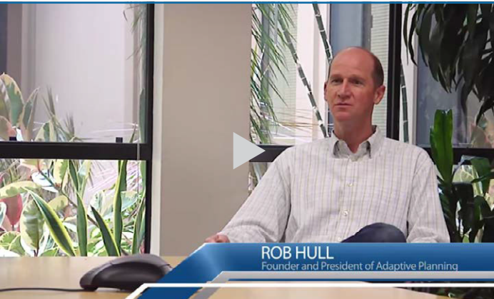
适应性洞察是高速增长型云企业发展壮大的关键因素。

“拥有一个能够随着我们业务发展而不断扩展的解决方案非常重要。Oracle NetSuite OneWorld 是一个可靠、系统化、值得信赖的解决方案，大大简化了许多工作。它让我们能够非常高效地管理全球财务和运营。”